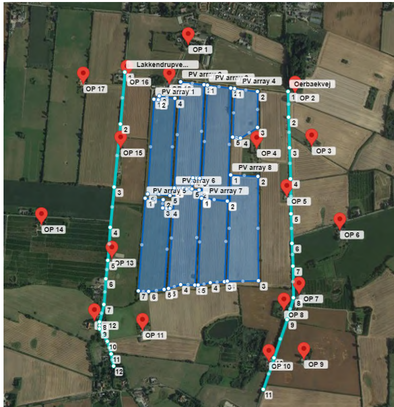
Figur 2 - Solcelleparken tegnet op i Forgesølar, med PV arrays, veje og observationspunkter.

Da området er stort, er beregningen delt op i 8 arealer som beregnes hver for sig og vurderes samlet m.h.t. genskin. Parken er tilnærmelsesvis delt op i et nordligt- og sydligt-felt. Nordlig: PV array 1-4. Sydlig: PV array 5-8.