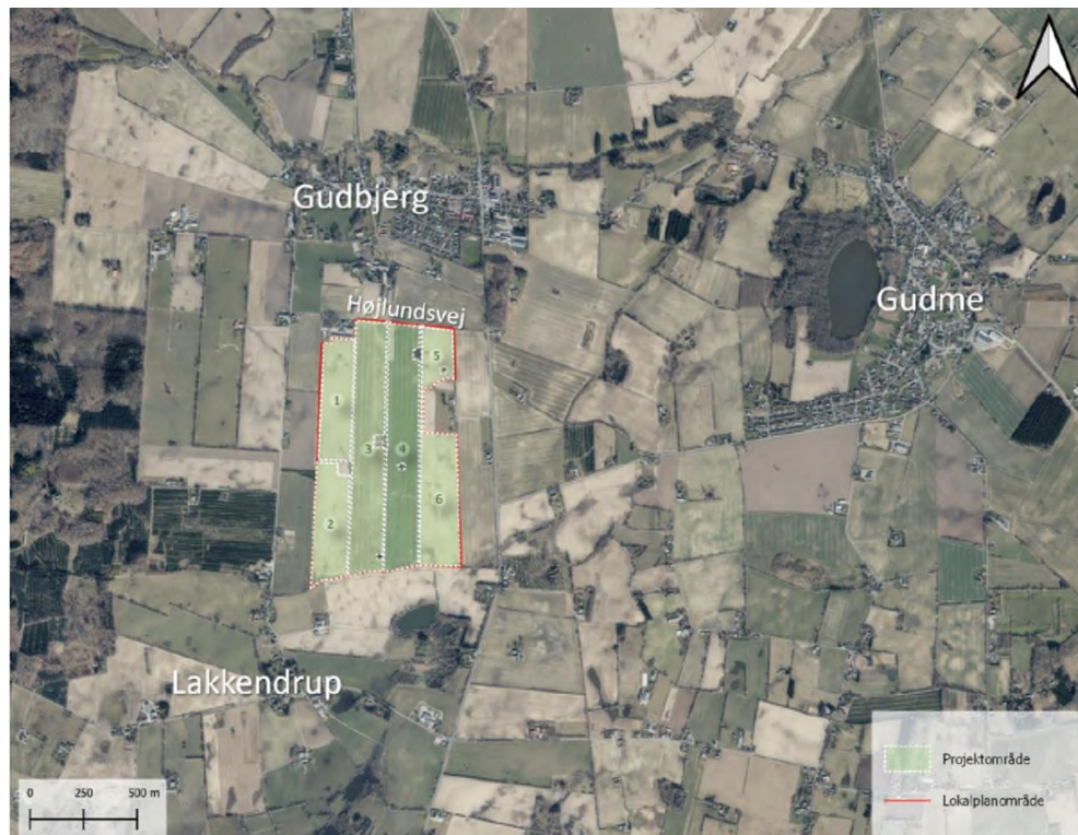
Figur 1 - Ortofoto af solcelleparkens placering.